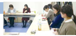
次回開催 2020年3月6日(金)

3ヶ月に1度のペースで開催している症例検討会。今回は9名の協会員様にご参加いただきました! テーマは「更年期症状と女性性の喪失」クライアントの訴える「更年期症状」という枠組みのみで見るとは、性格・仕事・家族・生活背景などホリスティックな視点から症状を考えることの大切さを感じました。また、アロマセラピーを行う上で、クライアントがより良い状態になるようサポートするためには、施術の「実践」「アセスメント」「振り返り」と評価が必要不可欠であることを改めて実感する時間となりました。また、女性性の喪失という繊細な部分についても、「繊細な部分こそ、繊細な部分だからこそ、共有をさせてほしい」とセラピストがクライアントを受け止める姿勢持つことの重要性も学びました。参加者様からは、「セラピストとして大切な視点に気づき、悩みがクリアになった」「繊細な部分こそ受け止めるという言葉の重みを感じた」など、日頃アロマケアを行う中で、大切にしたいこと、課題となる部分を発見できたという声を多く受け、今後のケアに繋がる時間となりました。アロマケアをする中で「こんな症例に困っている…」というものがありましたら、協会員同士でシェア・意見交換をし、視点をクリアにしませんか?