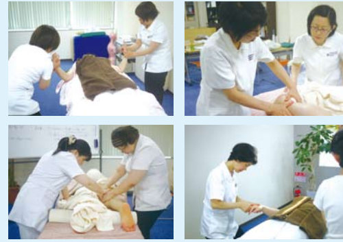
参加者さまの感想(一部抜粋)

今回の開催では、6名の協会員様にご参加いただきました。参加前に、更に磨きをかけたい部位や、手技を見直したい部位をお一人2か所挙げていただき、希望部位が近い方同士でペアを組み、重点的なブラッシュアップを行いました。(今回は背面と脚部を希望選択される方が多かったです!)